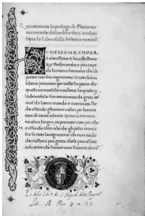
Ejemplar procedente de la librería de San Miguel de los Reyes, ahora en la Biblioteca Valenciana. Biblioteca Valenciana Nicolau Primitiu. Biblioteca Carreres

No todas las obras que alguna vez hubieran pertenecido a un convento o monasterio valenciano se quedaron en España. Muchas pasarían a manos extranjeras y están hoy en día depositadas en bibliotecas francesas, inglesas o norteamericanas. Este hecho fue favorecido por diversos fenómenos.