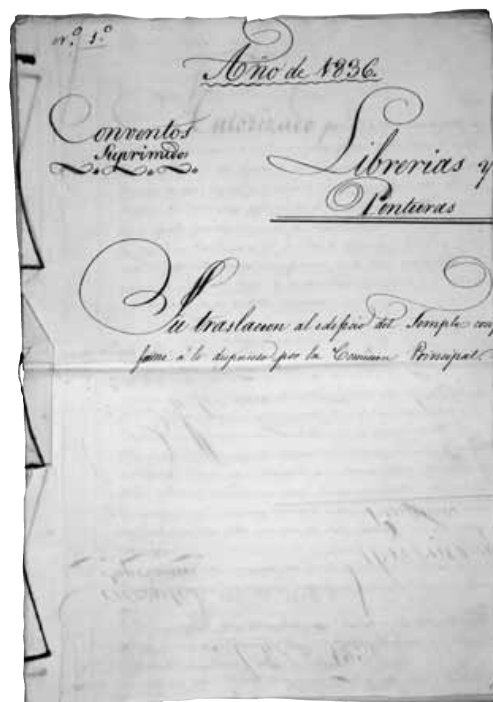
Inventario de librerías y pinturas de los conventos suprimidos. ARV. Propiedades antiguas, leg. nº 722

Tampoco faltaron murmuraciones sobre sustracciones llevadas a cabo por los oficiales o comisionados participantes en la recogida de efectos. Al comisionado encargado de recoger los efectos de la Valldigna, articulistas en la prensa le acusarían de haber huido a París con preciosos manuscritos miniados. 16