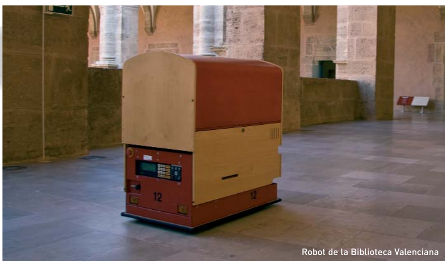
Robot de la Biblioteca Valenciana