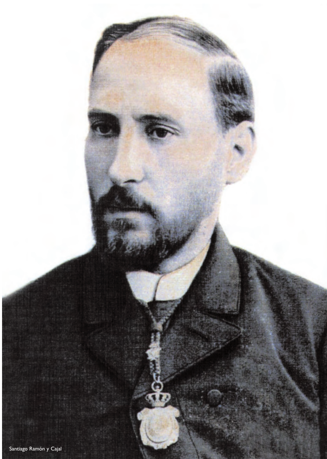
Santiago Ramón y Cajal

Dipòsit legal: V-139-2003 ISSN: 1885-3420 Exemplar gratuït. La revista no es fa responsable de les opinions expressades pels seus col·laboradors.