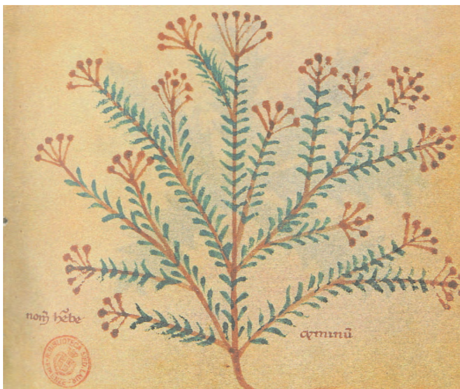
Comino ( Cominum Cyminum L.) pintura al temple de un códice. Siglo XIII